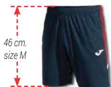
336 DARK NAVY/ RED/WHITE

Shorts with adjustable elastic waistband with inner drawstring. Includes two side pockets with zip closure and mesh interior making them lighter. Includes inner brief. Embroidered Joma logo.