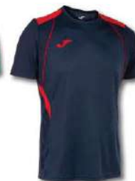
336 DARK NAVY/ RED