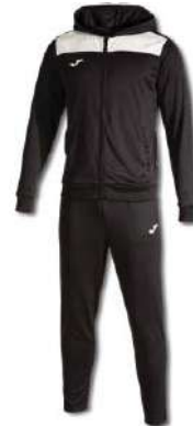
102 BLACK/ WHITE