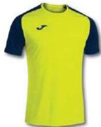
063 YELLOW FLUOR/ DARK NAVY