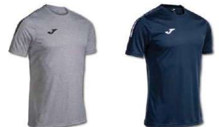
251 LIGHT MELANGE