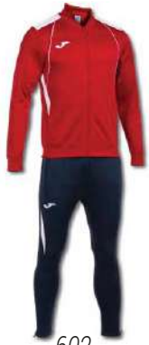
602 RED/WHITE/ DARK NAVY