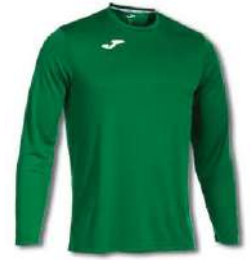
450 GREEN MEDIUM