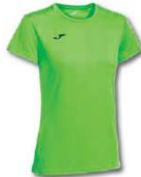
020 GREEN FLUOR