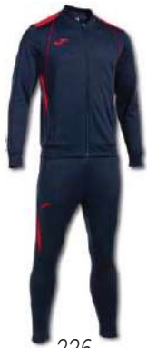
336 DARK NAVY/ RED