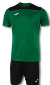
451 GREEN MEDIUM/ BLACK