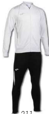
211 WHITE/ BLACK