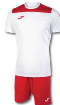
206 WHITE/ RED