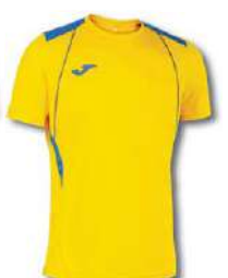
907 YELLOW/ ROYAL