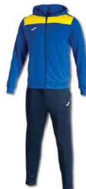
709 ROYAL/ YELLOW