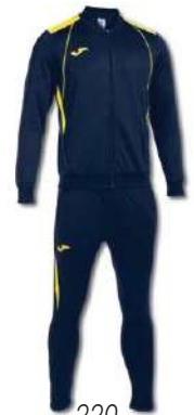
339 DARK NAVY/ YELLOW