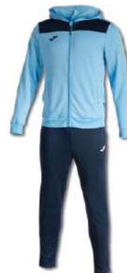
383 SKY BLUE/ DARK NAVY