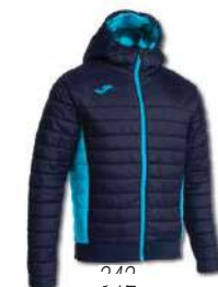
342 DARK NAVY/ TURQUOISE FLUOR