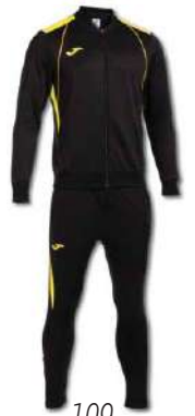
109 BLACK/ YELLOW