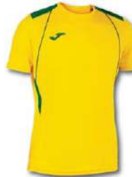
904 YELLOW/ GREEN MEDIUM