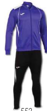
552 VIOLET/WHITE/ BLACK