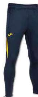
339 DARK NAVY/YELLOW