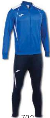
702 ROYAL/WHITE/ DARK NAVY