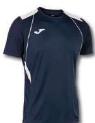
332 DARK NAVY/ WHITE