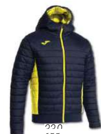
339 DARK NAVY/ YELLOW