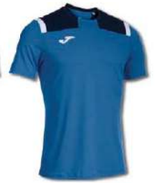
703 ROYAL/DARK NAVY