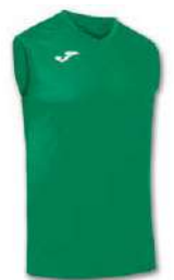
450 GREEN MEDIUM