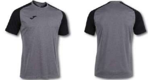
251 LIGHT MELANGE/ BLACK