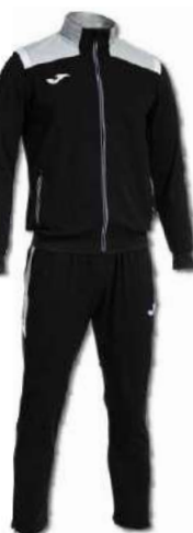
100 BLACK/MEDIUM GREY