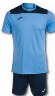
383 SKY BLUE/ DARK NAVY