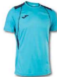
013 TURQUOISE FLUOR/ DARK NAVY