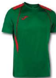
456 GREEN MEDIUM/ RED