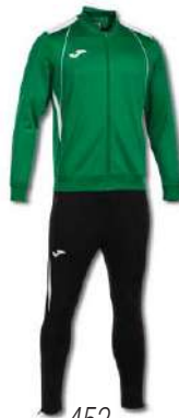
452 GREEN/WHITE/ BLACK