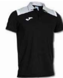
100 BLACK/ MEDIUM GREY