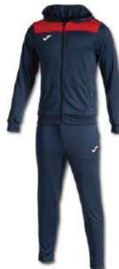
336 DARK NAVY/ RED