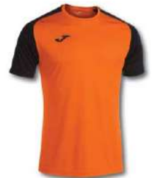
881 ORANGE/ BLACK