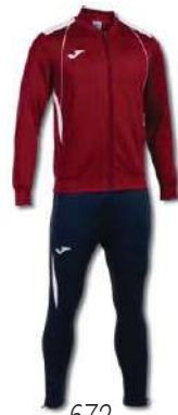
672 BURGUNDY/ WHITE/DARK NAVY