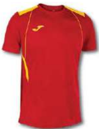
609 RED/ YELLOW