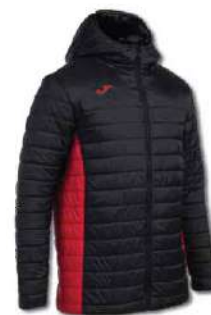
106 BLACK/ RED