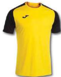
901 YELLOW/ BLACK