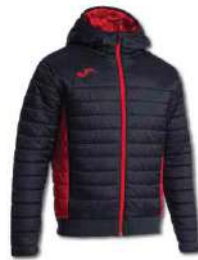
106 BLACK/ RED