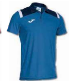
703 ROYAL/ DARK NAVY