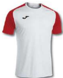
206 WHITE/ RED