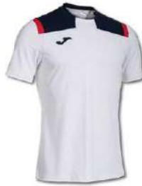
203 WHITE/DARK NAVY