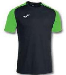
117 BLACK/ GREEN FLUOR