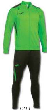
021 GREEN FLUOR/ BLACK