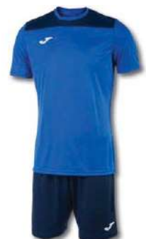
703 ROYAL/ DARK NAVY