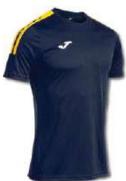
339 DARK NAVY/ YELLOW