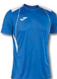
702 ROYAL/ WHITE