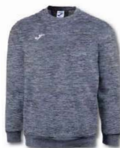
150 DARK MELANGE