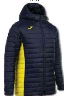
339 DARK NAVY/ YELLOW