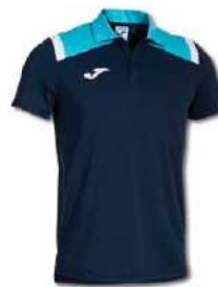
342 DARK NAVY/ TURQUOISE FLUOR