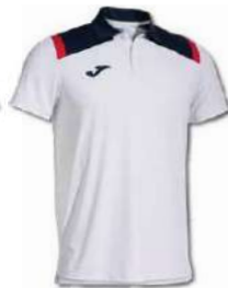
203 WHITE/ DARK NAVY