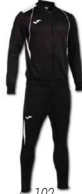
102 BLACK/ WHITE