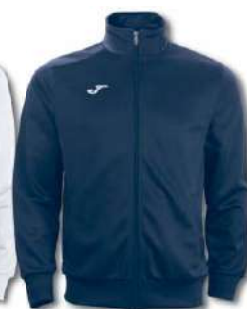
300 DARK NAVY