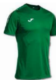
450 GREEN MEDIUM