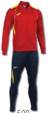
609 RED/YELLOW/ DARK NAVY