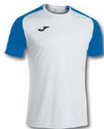
207 WHITE/ ROYAL