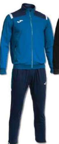
703 ROYAL/DARK NAVY