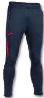
336 DARK NAVY/RED