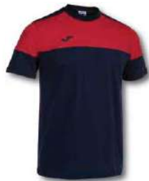
336 DARK NAVY/RED