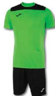
021 FLUOR GREEN/ BLACK