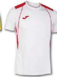
206 WHITE/ RED