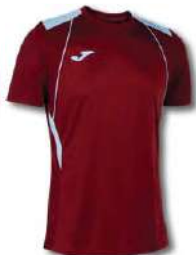
682 RUBY/ SKY