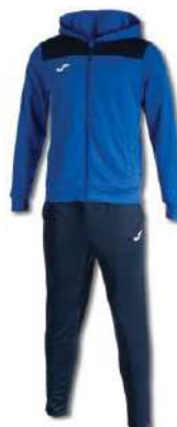
703 ROYAL/ DARK NAVY