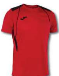
601 RED/ BLACK