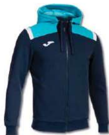
342 DARK NAVY/ TURQUOISE FLUOR