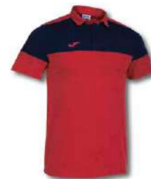
603 RED/ DARK NAVY