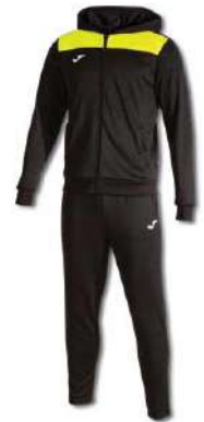
121 BLACK/ YELLOW FLUOR