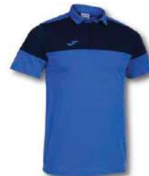
703 ROYAL/DARK NAVY