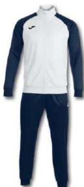
203 WHITE/ DARK NAVY