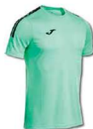
422 CABBAGE/ BLACK