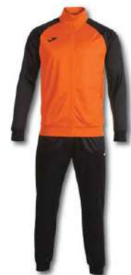
881 ORANGE/ BLACK