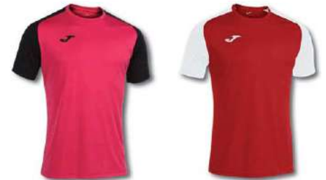
501 RASPBERRY/ BLACK