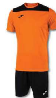
881 ORANGE/ BLACK