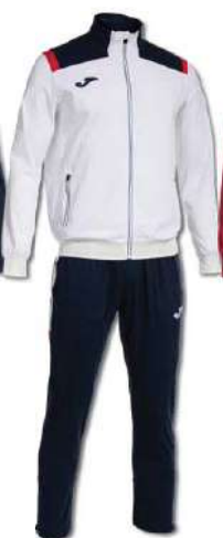
203 WHITE/DARK NAVY