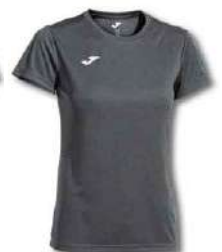
150 DARK MELANGE