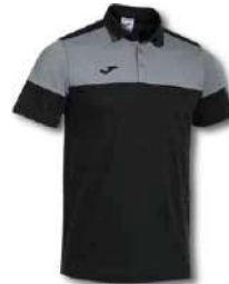
111 BLACK/ MEDIUM GREY