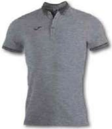
250 LIGHT MELANGE