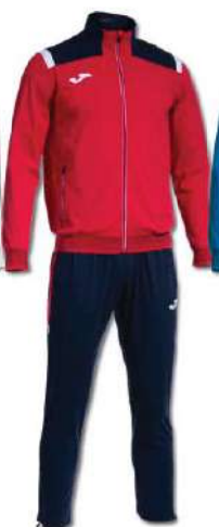
603 RED/DARK NAVY