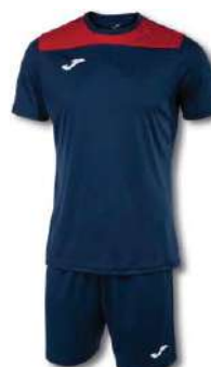
336 DARK NAVY/ RED