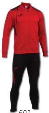
601 RED/ BLACK