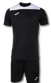
102 BLACK/ WHITE