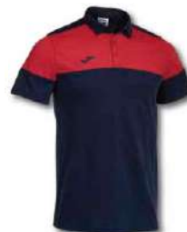
336 DARK NAVY/RED