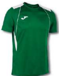
452 GREEN MEDIUM/ WHITE