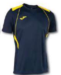
339 DARK NAVY/ YELLOW

TODOS LOS COLORES DISPONIBLES EN MANGA LARGA. ALL COLOURS AVAILABLE IN LONG SLEEVE.