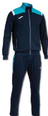
342 DARK NAVY/ TURQUOISE FLUOR