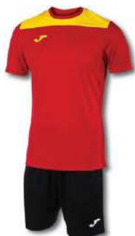
609 RED/YELLOW/ BLACK