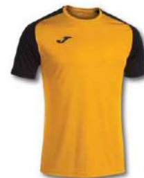
081 AMBER/ BLACK