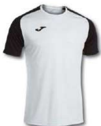
201 WHITE/ BLACK