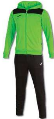
021 FLUOR GREEN/ BLACK