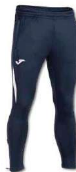
332 DARK NAVY/WHITE