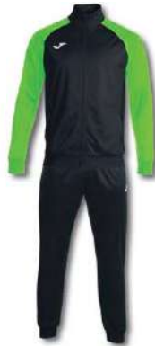
117 BLACK/ GREEN FLUOR