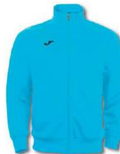
010 TURQUOISE FLUOR