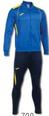
709 ROYAL/YELLOW/ DARK NAVY