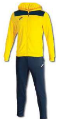
903 YELLOW/ DARK NAVY