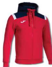
603 RED/ DARK NAVY