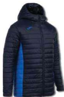
337 DARK NAVY/ ROYAL