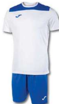
207 WHITE/ ROYAL