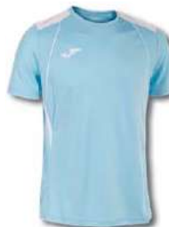
352 SKY/ WHITE