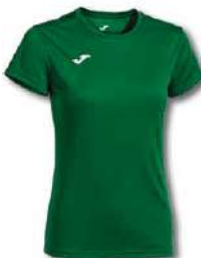
450 GREEN MEDIUM