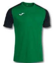
451 GREEN MEDIUM/ BLACK