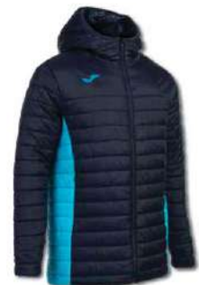
342 DARK NAVY/ TURQUOISE FLUOR