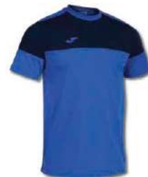
703 ROYAL/DARK NAVY