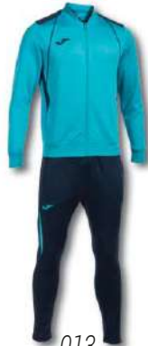
013 TURQUOISE FLUOR/ DARK NAVY