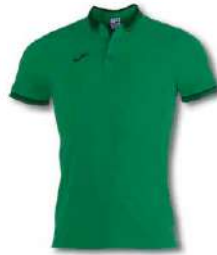
450 GREEN MEDIUM