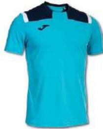
013 TURQUOISE FLUOR/ DARK NAVY