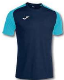
342 DARK NAVY/ TURQUOISE FLUOR