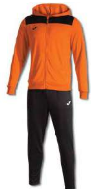
881 ORANGE/ BLACK