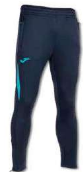
342 DARK NAVY/ TURQUOISE FLUOR