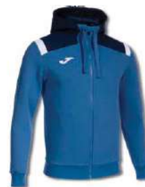
703 ROYAL/ DARK NAVY