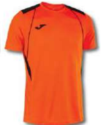
881 ORANGE/ BLACK