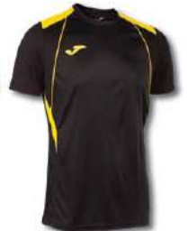
109 BLACK/ YELLOW