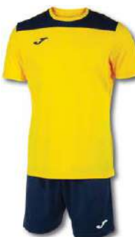
903 YELLOW/ DARK NAVY