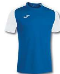
702 ROYAL/ WHITE