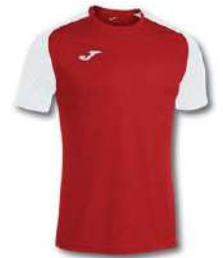
602 RED/ WHITE