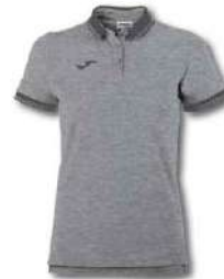
250 LIGHT MELANGE