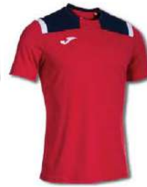
603 RED/DARK NAVY