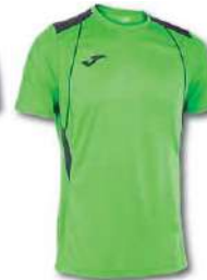
021 GREEN FLUOR/ BLACK