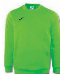
020 FLUOR GREEN