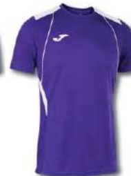
552 VIOLET/ WHITE