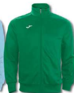
450 GREEN MEDIUM