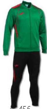
456 GREEN/RED/ BLACK