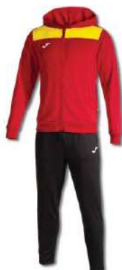
609 RED/YELLOW/ BLACK