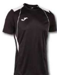
102 BLACK/ WHITE

TODOS LOS COLORES DISPONIBLES EN MANGA LARGA. ALL COLOURS AVAILABLE IN LONG SLEEVE.