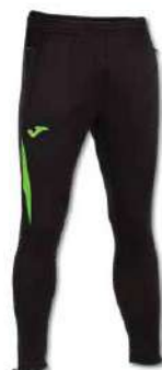
117 BLACK/ GREEN FLUOR