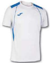
207 WHITE/ ROYAL