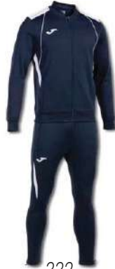
332 DARK NAVY/ WHITE