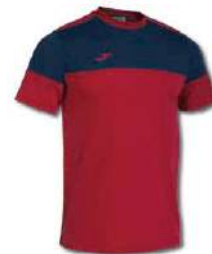
603 RED/DARK NAVY