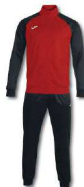
601 RED/ BLACK