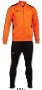
881 ORANGE/ BLACK