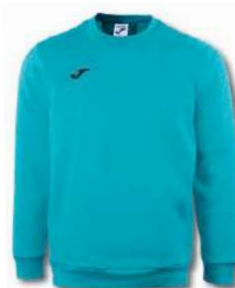
010 TURQUOISE FLUOR