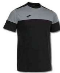
111 BLACK/MEDIUM GREY