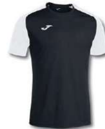
102 BLACK/ WHITE