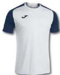
203 WHITE/ DARK NAVY