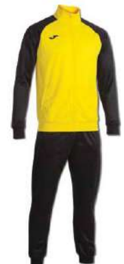
901 YELLOW/ BLACK