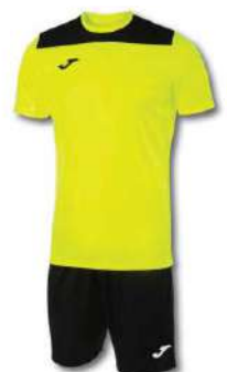
061 FLUOR YELLOW/ BLACK