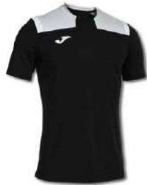
100 BLACK/MEDIUM GREY