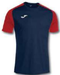
336 DARK NAVY/ RED