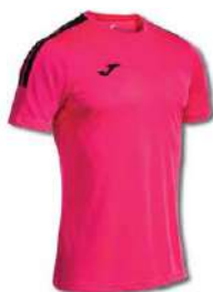
501 RASPBERRY/ BLACK