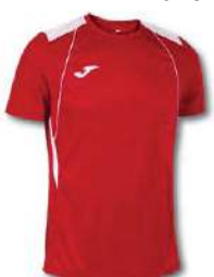
602 RED/ WHITE