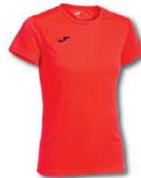
040 DARK ORANGE FLUOR