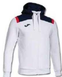
203 WHITE/ DARK NAVY