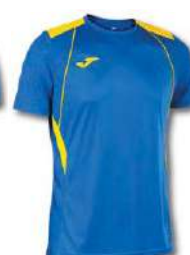
709 ROYAL/ YELLOW