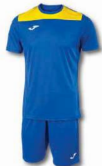
709 ROYAL/ YELLOW