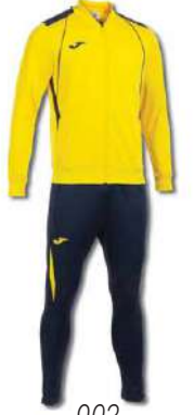
903 YELLOW/ DARK NAVY