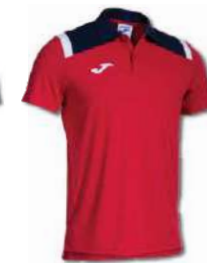
603 RED/ DARK NAVY