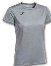
250 LIGHT MELANGE