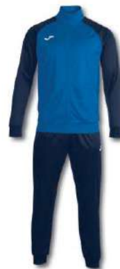
703 ROYAL/ DARK NAVY