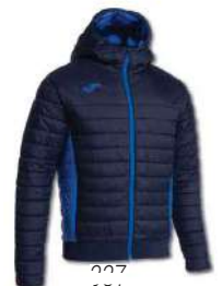
337 DARK NAVY/ ROYAL