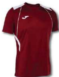
672 RUBY/ WHITE