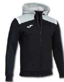
100 BLACK/ MEDIUM GREY